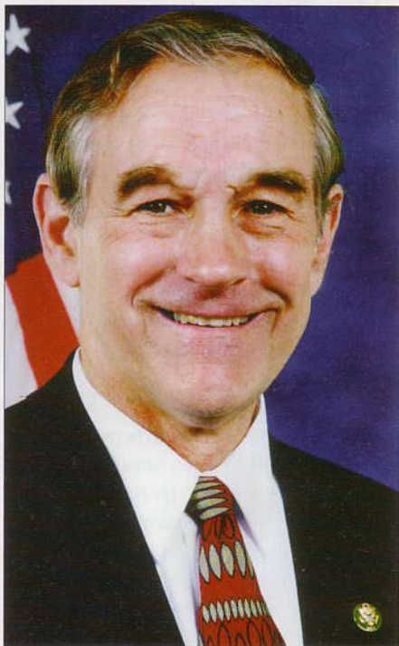
⊙ Ron Paul is een Amerikaanse presidentskandidaat. Kent u hem?

in columns voor de teloorgang van onderzoekende journalistiek. Door de merkbare teruggang van de nieuwwaarde van kranten gaan mensen op zoek naar alternatieve bronnen van informatie. De oplages van vrijwel alle kranten lopen schrikbarend terug en het aantal internetaansluitingen neemt toe. Het is zelfs zo erg dat uitgevers hun kranten nu maar gratis uitdelen, maar ook die gratis kranten zijn meestal niet veel meer dan een verzameling AP- en Reuters-berichten zonder een spootje onderzoekend journalistiek.