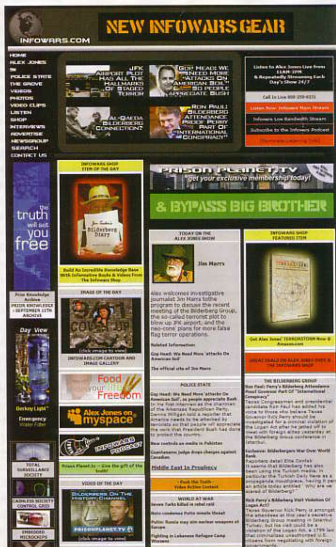
Infowars, de website van Ales Jones