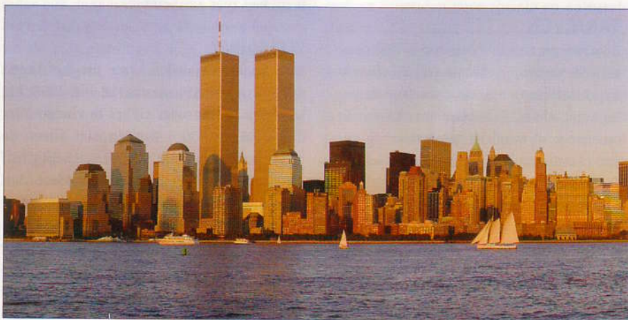
Waren de aanslagen van 11 september werkelijk het werk van terroristen?

Iedereen kan inzien dat negentien amateurs met Stanley-mesjes geen honderden